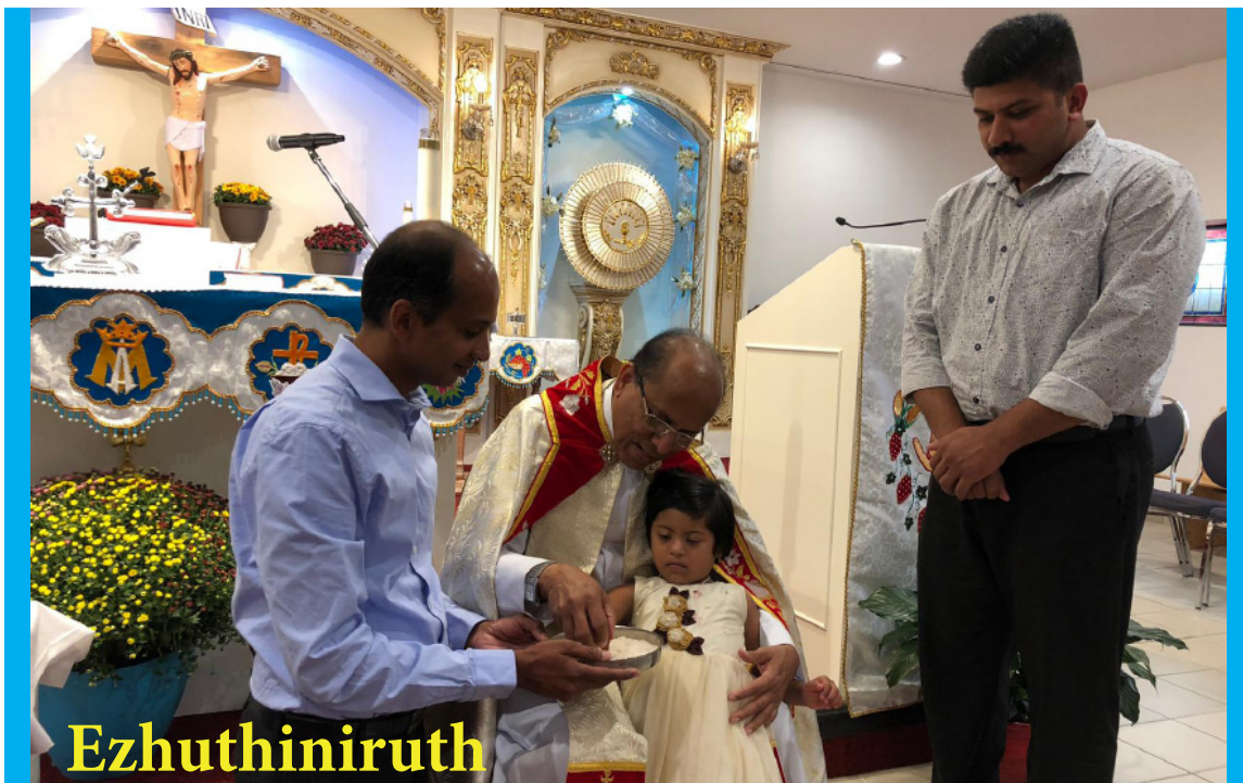
Ezhuthiniruth - 8th September 2019