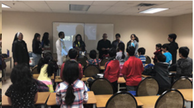
Holy Childhood Association