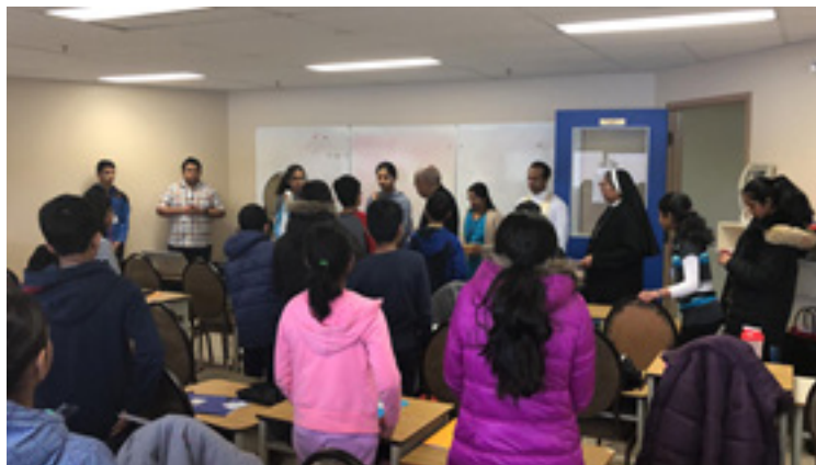
Cherupushpa Mission League