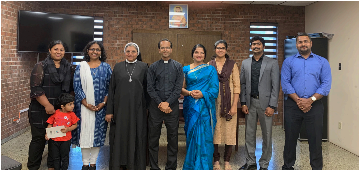
Youth and catechism team for focus -2019