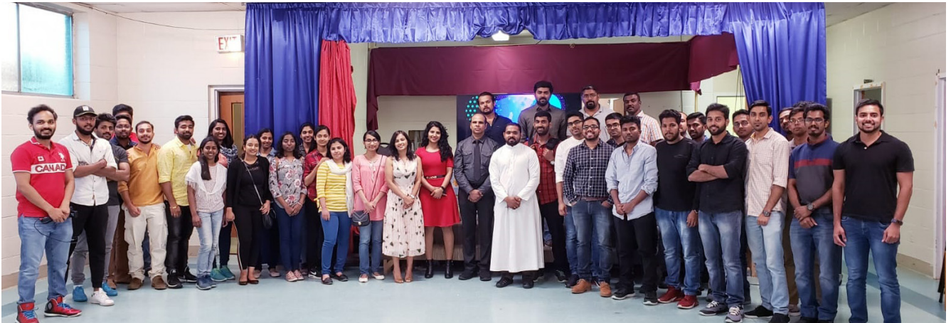
Law Awareness Session