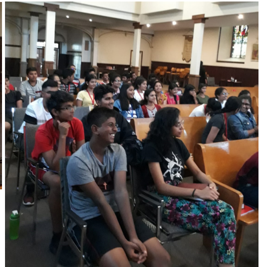
SOE at St. Ignatius deemerton