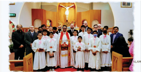
പൗരസ്ത്യ സഭയുടെ ആരാധനക്രമങ്ങൾ പഠിക്കുക എന്ന ഉദ്ദേശത്തോടെ ടൊറന്റോയിലെ സെന്റ് അഗസ്റ്റിൻസ് സെമിനാരിയിൽ നിന്നുള്ള 10 പേരടങ്ങുന്ന സെമിനാരി സംഘം സെന്റ് തോമസ് സിറോ മലബാർ കാത്തലിക് ദേവാലയം സന്ദർശിച്ചു