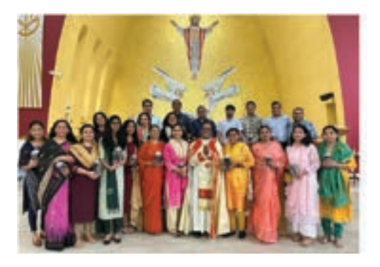
Catechism Teacher's Day