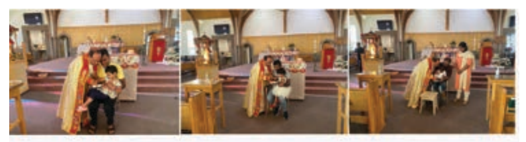
Children starting their "Adyaksharangal" on Pentecost day