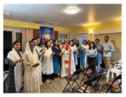
Nurses' Ministry Gathering